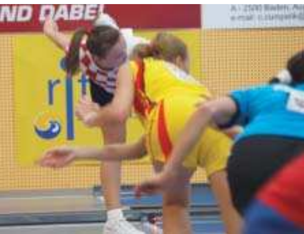
KEGELN: III. Einzel-WM in Ritzing