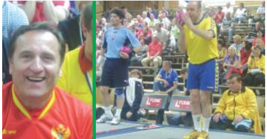
III. Kegel-Weltmeisterschaften | Teams Damen + Herren in Dettenheim (Baden):